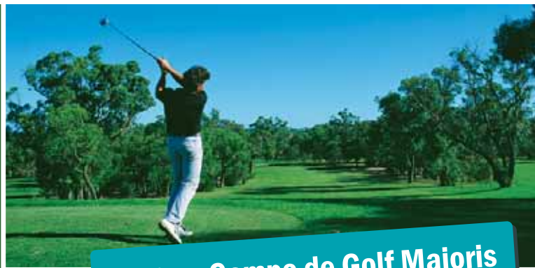
Junto a Campo de Golf Maioris

También podrá disfrutar de los deportes náuticos, buceo y recorrer sus innumerables rutas cicloturísticas por paisajes arbolados o dando un paseo hasta el nuevo campo de golf, situado sólo a 50 metros de Residencial Costa Albatros.